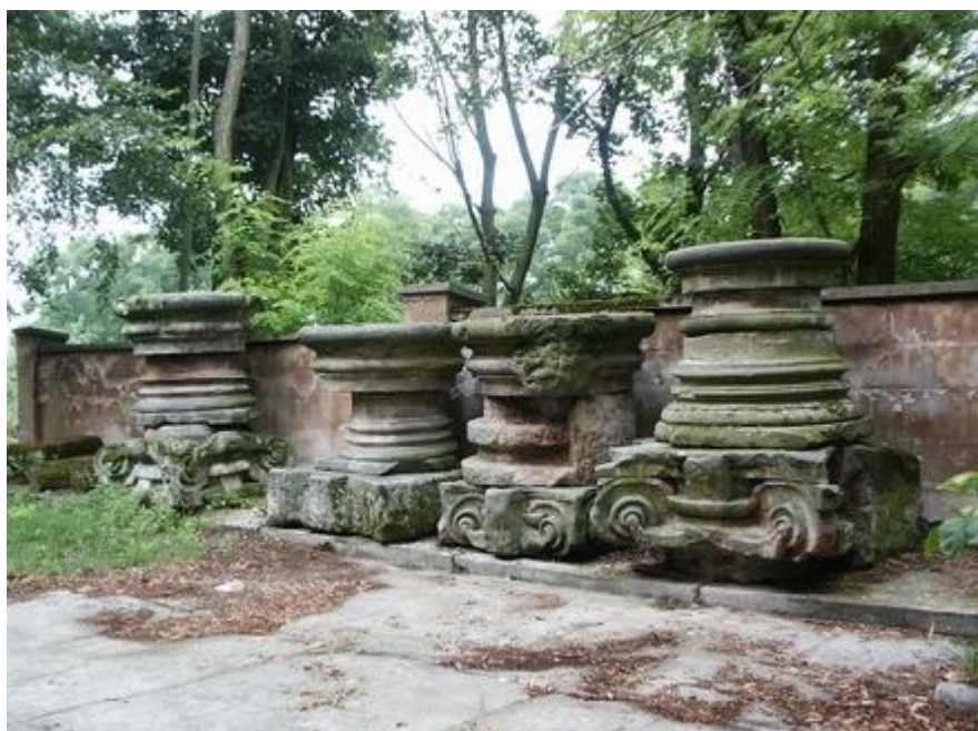
Źródło: Zasoby internetowe