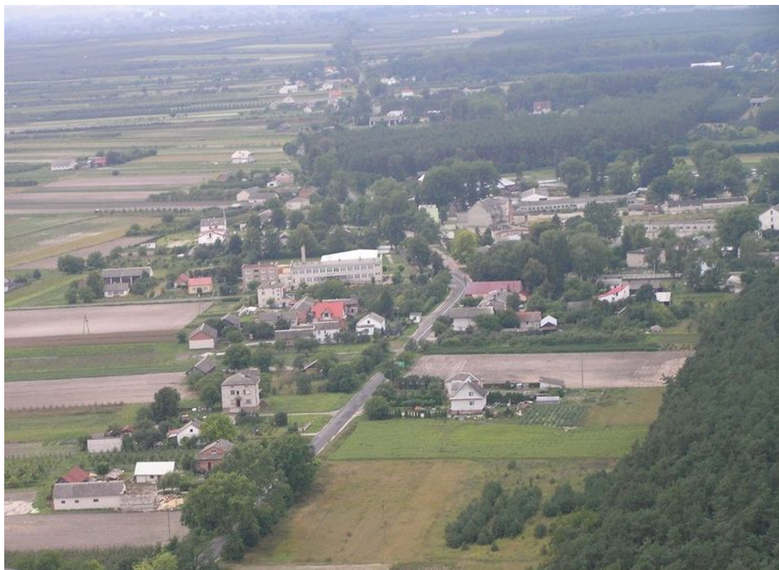
Fot nr1,2: Panorama Łazisk